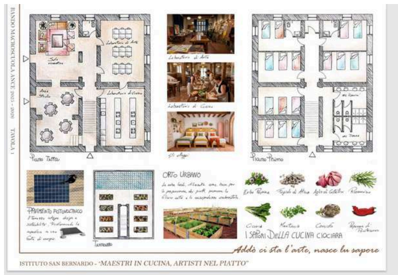
Tavola progettuale- Istituto San Bernardo Casamari