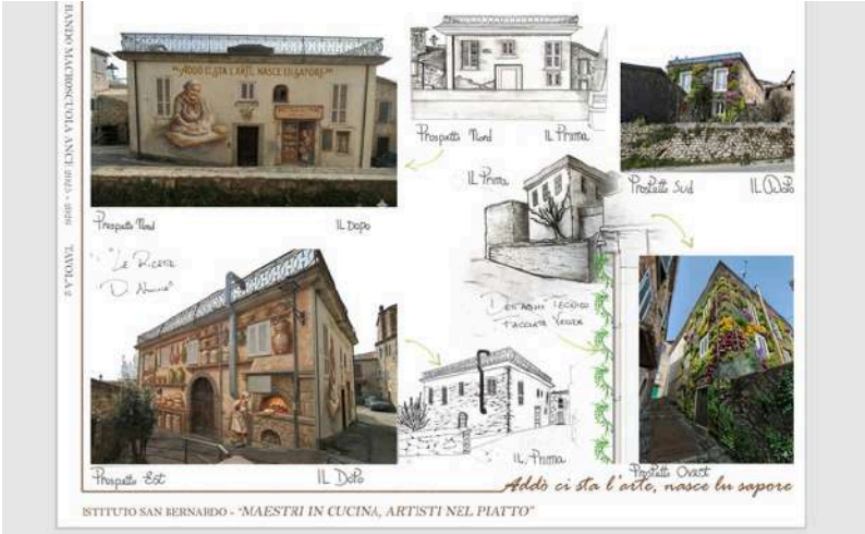
Tavola progettuale- Istituto San Bernardo Casamari