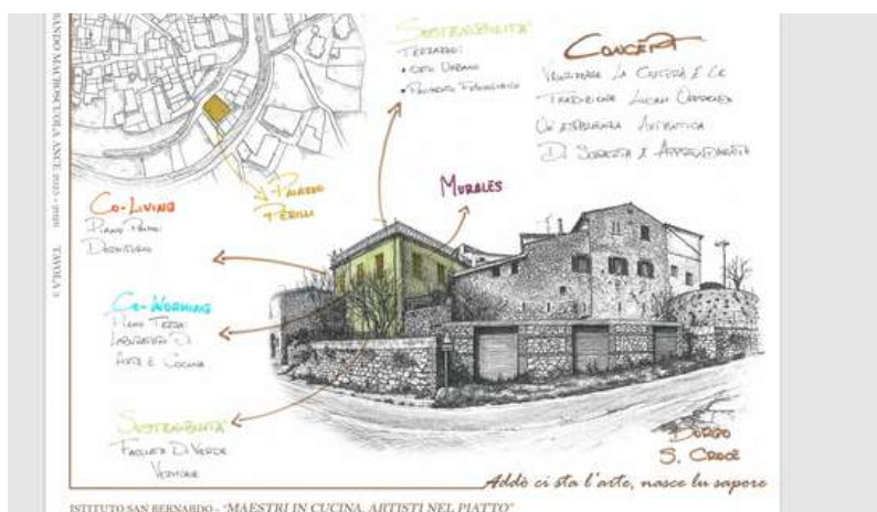
Tavola progettuale -Istituto San Bernardo Casamari